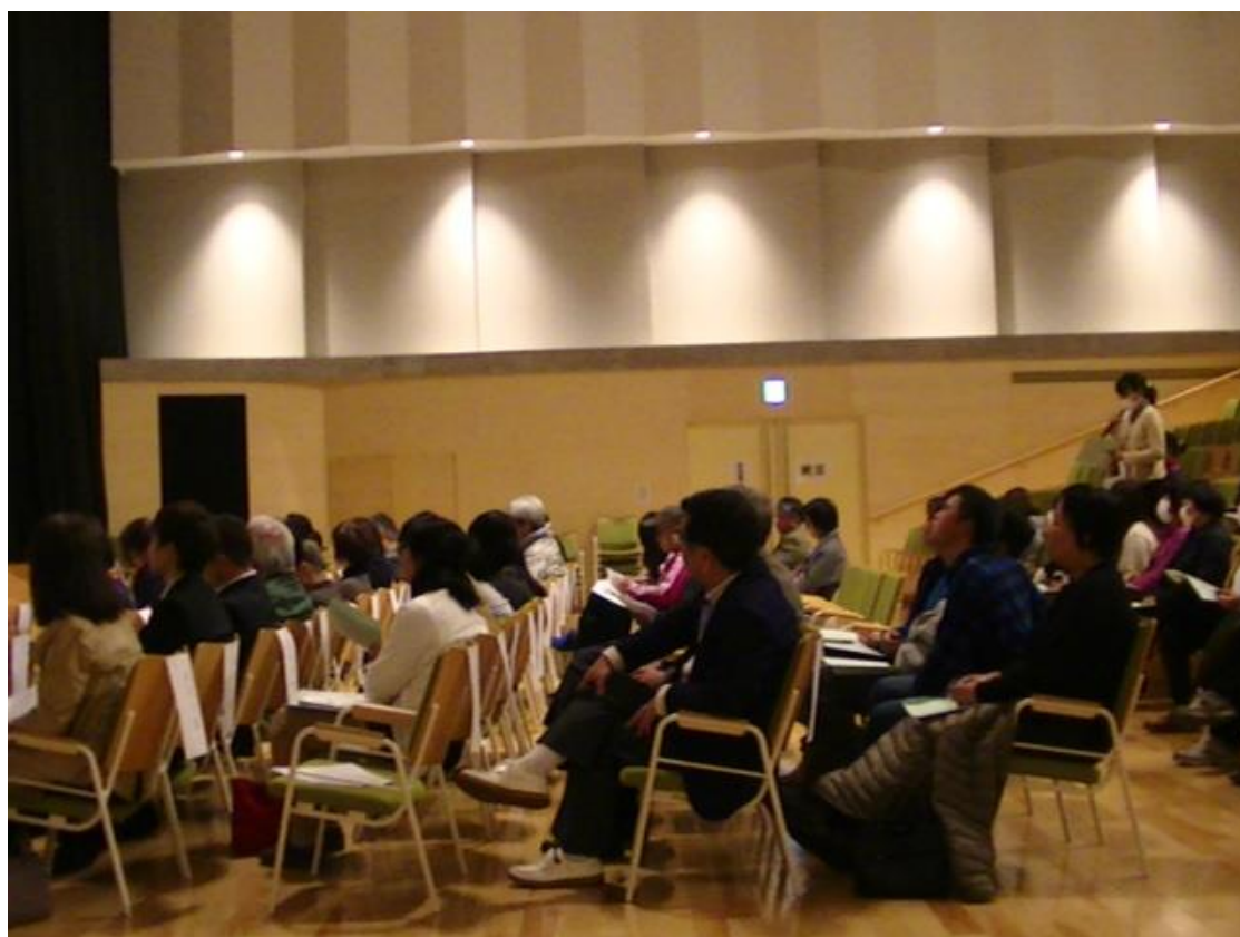
熱心な受講者からの質疑があった