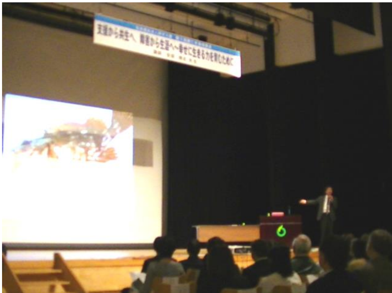
1時間半にわたり講義が行われた