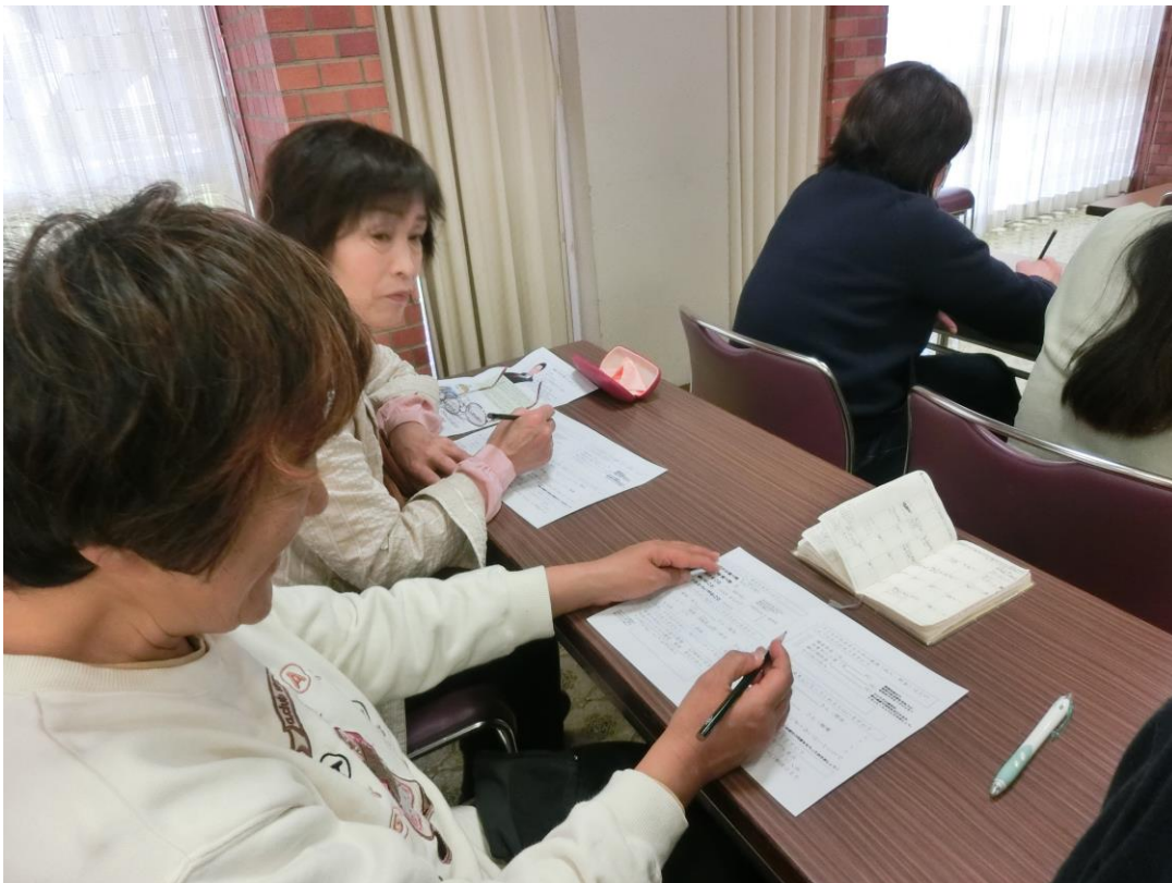
親の死後を想定して、その後の計画等を立てているところ